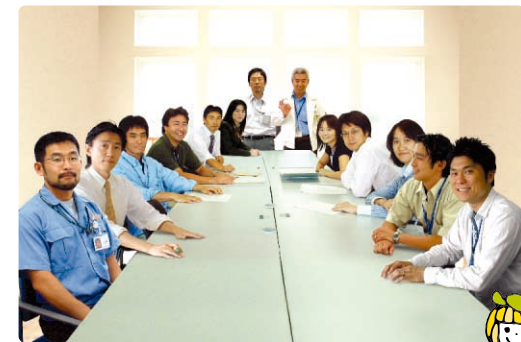
サテ★カフェ編集部の みんなだよ!

秋なので中国地方ぶらり旅に出かけました。厳 島神社はニュースで言っていたとおり、台風で大 変な被害を受けていました。参拝できなくて残念。 さて、旅行中はカーナビが大活躍。ふと、このカー ナビは人工衛星からのデータで動いているんだ と思ったら、人工衛星ってすごいなと思いました。 そして、同時に少し身近に感じました。ナビがあ れば山道でも安心なので、どこまでもどこまでも 走って行って、結局山陽・山陰地方をぐるっと一 回り。ちょっとだけ九州(門司港)にも立ち寄りま した。レジャーの秋、次はどこへ行こうかな。(森)