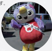
鳩山町イメージキャラクター「はーとん」も来るよ!